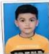
Advik II C