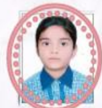
Ummeh Hadiya Beg II A